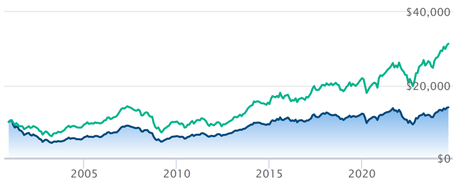
Catégorie d'actions européennes BQÉ Invesco A Dow Jones Europe TR Index (C$)

Les renseignements qui figurent ici ne concernent que les fonds désignés dont le nom figure ci-dessus. Le titulaire d'une police de BMO Société d'assurance-vie n'achète ni part de ce fonds désigné ni intérêt juridique dans aucun titre.