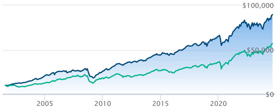
Fonds actions productives de revenu Dynamique A Indice composé S&P/TSX RT

Les renseignements qui figurent ici ne concernent que les fonds désignés dont le nom figure ci-dessus. Le titulaire d'une police de BMO Société d'assurance-vie n'achète ni part de ce fonds désigné ni intérêt juridique dans aucun titre.