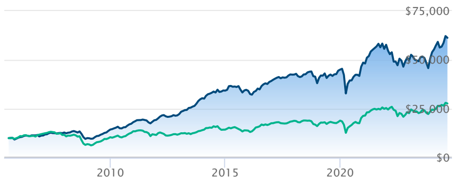
Fonds actions nord-américaines petite/moy cap CI A Indice d'actions de PME principalement can Fundata

Les renseignements qui figurent ici ne concernent que les fonds désignés dont le nom figure ci-dessus. Le titulaire d'une police de BMO Société d'assurance-vie n'achète ni part de ce fonds désigné ni intérêt juridique dans aucun titre.