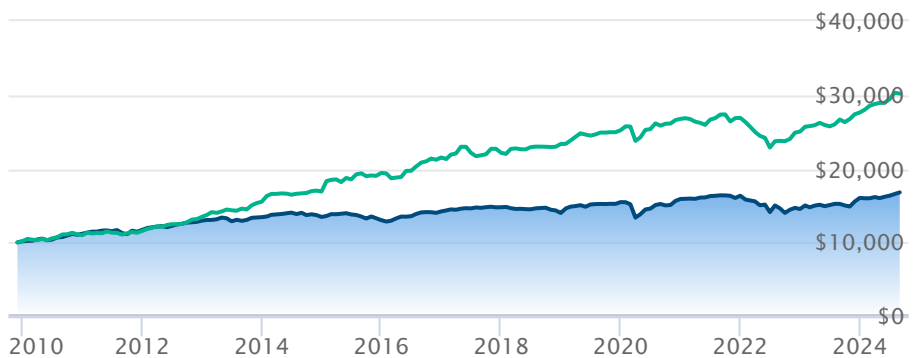
BMO Fds obligations améric à rendement élevé Cnsl ICE BofA Global High Yield Index TR CAD

Les renseignements qui figurent ici ne concernent que les fonds désignés dont le nom figure ci-dessus. Le titulaire d'une police de BMO Société d'assurance-vie n'achète ni part de ce fonds désigné ni intérêt juridique dans aucun titre.