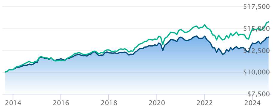
BMO Portfeuille FNB de revenu série Conseiller Index équilibré canadien-axé sur rev fixe Fundata

Les renseignements qui figurent ici ne concernent que les fonds désignés dont le nom figure ci-dessus. Le titulaire d'une police de BMO Société d'assurance-vie n'achète ni part de ce fonds désigné ni intérêt juridique dans aucun titre.