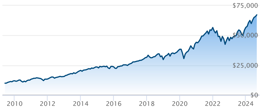
FINB BMO S&P 500 couvert en CAD (ZUE)