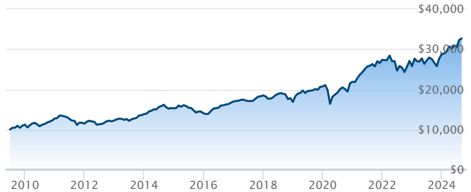
FINB BMO S&P/TSX composé plafonné (ZCN)