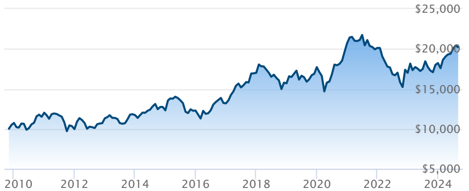
FINB BMO MSCI marchés émergents (ZEM)

Le rendement passé n'est pas garant des résultats futurs. Les taux de rendement indiqués sont les taux de rendement composés annuels historiques globaux et tiennent compte de l'évolution des rendements et du réinvestissement des distributions. Dans le cadre des comptes indiciels gérés, des comptes indiciels de portefeuilles gérés et des comptes indiciels en fonction du marché, des intérêts qui reflètent le rendement net d'un placement sous-jacent déterminé sont crédités, moins les frais de gestion quotidiens de BMO Société d'assurance-vie. Ces taux de rendement ne tiennent pas compte des frais de gestion actuels de BMO Société d'assurance-vie ou des frais actuels de polices d'assurance vie universelle, qu'il faut inclure pour le calcul du rendement net obtenu sur le compte.