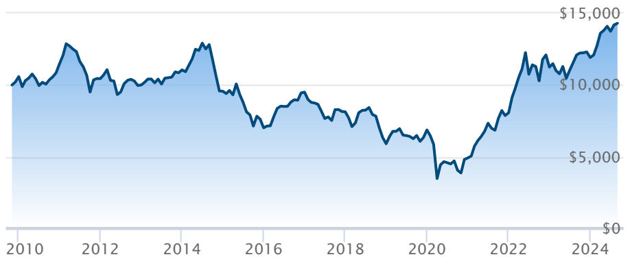
FINB BMO équilibré pétrole et gaz (ZEO)

Le rendement passé n'est pas garant des résultats futurs. Les taux de rendement indiqués sont les taux de rendement composés annuels historiques globaux et tiennent compte de l'évolution des rendements et du réinvestissement des distributions. Dans le cadre des comptes indiciels gérés, des comptes indiciels de portefeuilles gérés et des comptes indiciels en fonction du marché, des intérêts qui reflètent le rendement net d'un placement sous-jacent déterminé sont crédités, moins les frais de gestion quotidiens de BMO Société d'assurance-vie. Ces taux de rendement ne tiennent pas compte des frais de gestion actuels de BMO Société d'assurance-vie ou des frais actuels de polices d'assurance vie universelle, qu'il faut inclure pour le calcul du rendement net obtenu sur le compte.