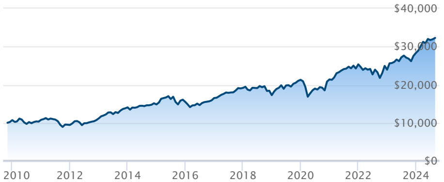
FINB BMO MSCI EAFE couvert en CAD (ZDM)