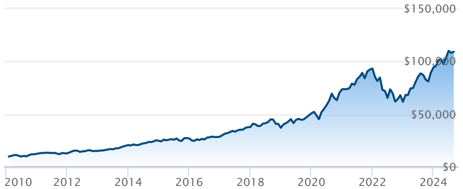
FINB BMO actions du Nasdaq 100 cvt en CAD (ZQQ)