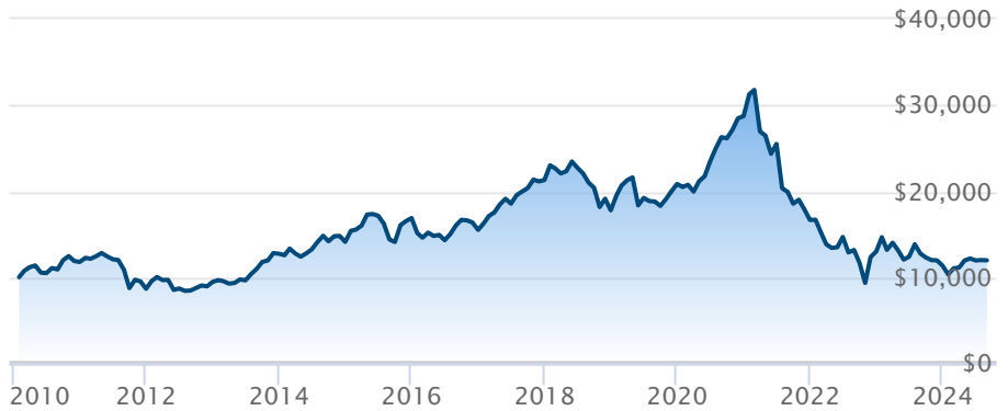
FINB BMO MSCI China ESG Leaders (ZCH)