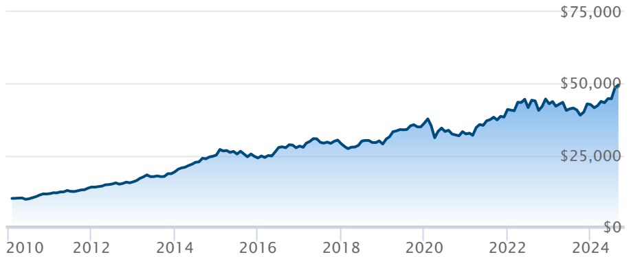
FINB BMO infrastructures mondiales (ZGI)

Le rendement passé n'est pas garant des résultats futurs. Les taux de rendement indiqués sont les taux de rendement composés annuels historiques globaux et tiennent compte de l'évolution des rendements et du réinvestissement des distributions. Dans le cadre des comptes indiciels gérés, des comptes indiciels de portefeuilles gérés et des comptes indiciels en fonction du marché, des intérêts qui reflètent le rendement net d'un placement sous-jacent déterminé sont crédités, moins les frais de gestion quotidiens de BMO Société d'assurance-vie. Ces taux de rendement ne tiennent pas compte des frais de gestion actuels de BMO Société d'assurance-vie ou des frais actuels de polices d'assurance vie universelle, qu'il faut inclure pour le calcul du rendement net obtenu sur le compte.