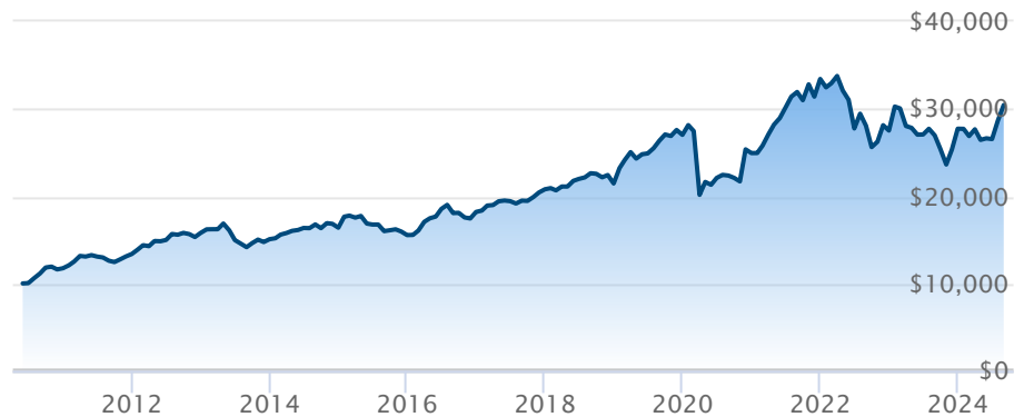
FINB BMO équi pondéré de FPI (ZRE)