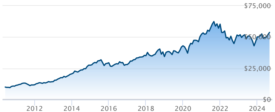
FINB BMO équilibré US de santé cvt en CAD (ZUH)