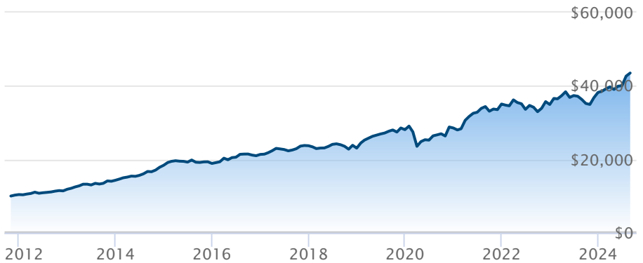
FNB BMO actions canadiennes fbl volatilité (ZLB)