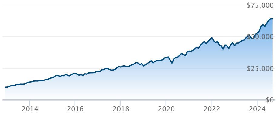
FINB BMO S&P 500 (ZSP)