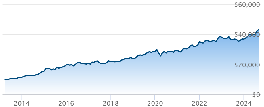
FNB BMO actions américaines fbl volatilité (ZLU)