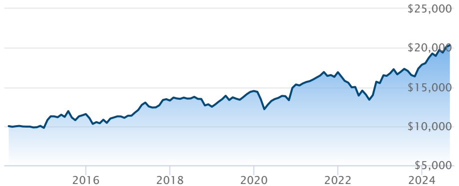
FINB BMO MSCI EAFE (ZEA)