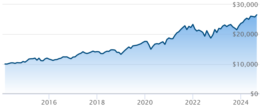
FINB BMO MSCI Europe haute qual cvt en CAD (ZEQ)