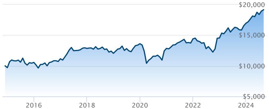
FNB BMO internationales de dividendes (ZDI)