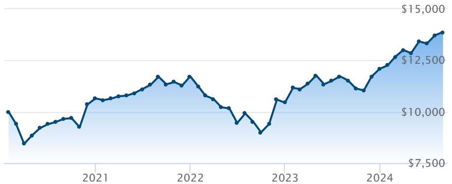
FINB BMO MSCI EAFE ESG Leaders (ESGE)