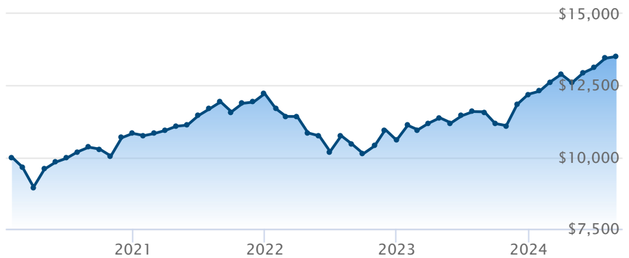
FNB BMO ESG Équilibré (ZESG)

Le rendement passé n'est pas garant des résultats futurs. Les taux de rendement indiqués sont les taux de rendement composés annuels historiques globaux et tiennent compte de l'évolution des rendements et du réinvestissement des distributions. Dans le cadre des comptes indicuels gérés, des comptes indicuels de portefeuilles gérés et des comptes indicuels en fonction du marché, des intérêts qui reflètent le rendement net d'un placement sous-jacent déterminé sont crédités, moins les frais de gestion quotidiens de BMO Société d'assurance-vie. Ces taux de rendement ne tiennent pas compte des frais de gestion actuels de BMO Société d'assurance-vie ou des frais actuels de polices d'assurance vie universelle, qu'il faut inclure pour le calcul du rendement net obtenu sur le compte.